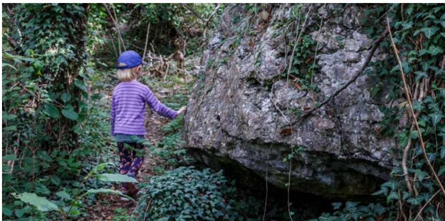
Naturreseptatet Bergbetningen.

Gotland Nature, Vamlingbo sockenförening, Vamlingbo prästgård, Naturum Gotland, Länsstyrelsen i Gotlands län, Stora Karlsö, Naturskyddsföreningen Gotland och STF Gotland.