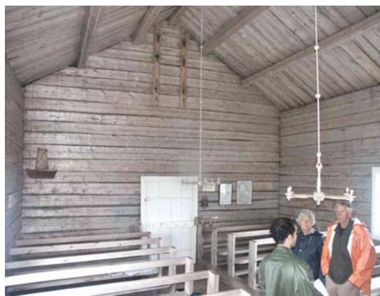
Interiör mot ingång i öster 2003.