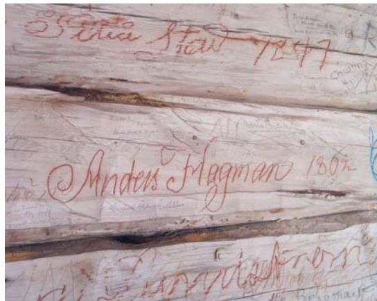
Exempel på äldre namnteckningar gjorda med rödkrita, foto 2003.