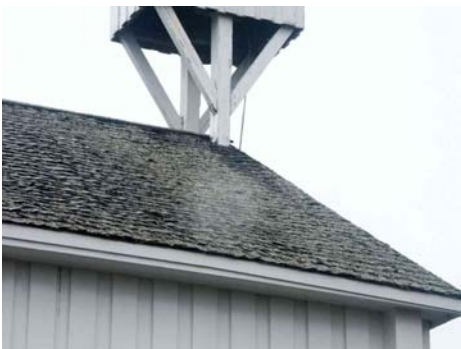
Spåntak och klockbock före restaurering (2003).