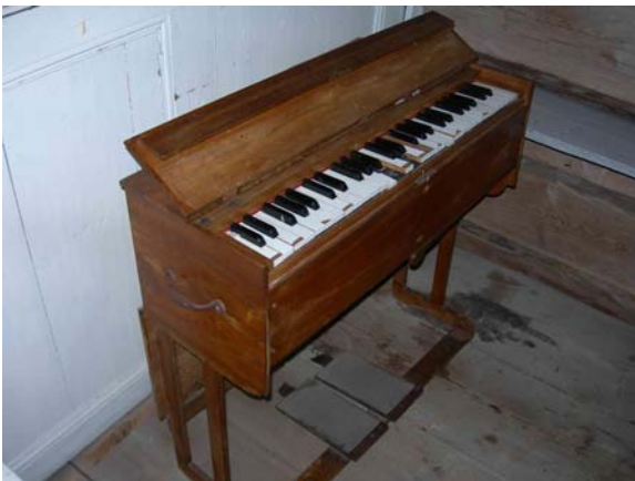
Tramporgel i koret, 2007.