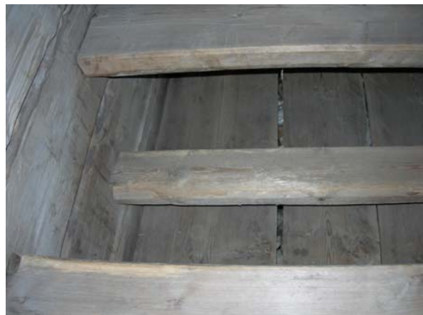
Närbilder på det såpskurade golvet och bänkgavlarnas montering i golvstock och vägg (2007).