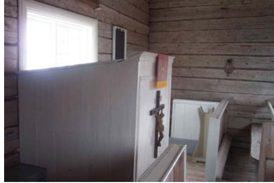
Den öppna bänkinredningen och altarpredikstolen.