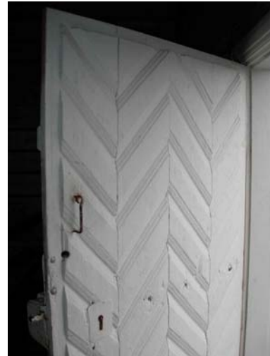
Altartavlan från 1780, kopia av uppmåtningsritning av A. Gellerstedt 1860 och dörrens utsida (2007).