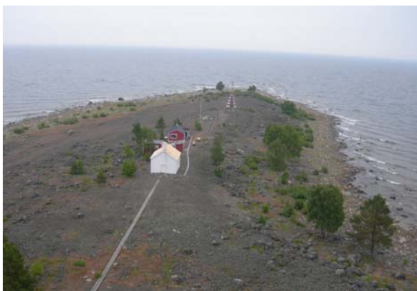
Kapellmiljön fotad från fyren 2007.