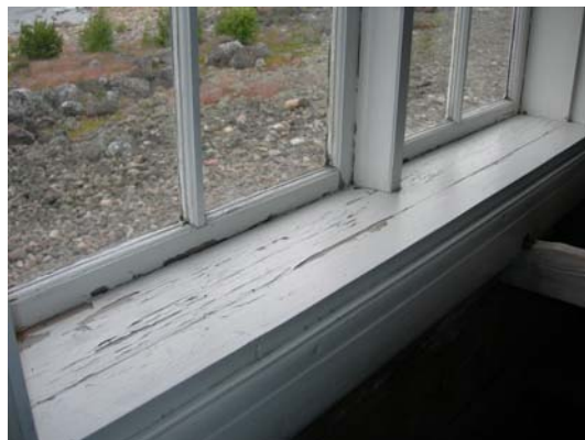
Fönstren är mittpostfönster med enkla bågar indelade i sex rutor (2007).