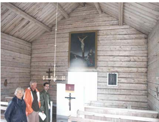
Interiör mot kor 2003.