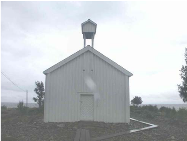
Kapellet saknar fastighetsbeteckning, men står på mark ägd av Kinnbäcks samfällighet. Begravningsplats saknas. Foto 2003.