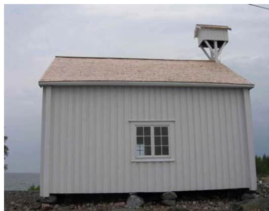
Exteriör mot sydost (vänster bild) och norr (höger bild) efter takomläggning 2007.