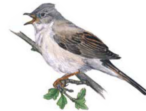
Törnsångaren ( Sylvia communis ) är en rastlös liten sångare som far ut och in i täta buskage. Den sjunger även i flykten. Här sitter den på en kvist av hagtorn ( Crataegus sp. ) som växer i skogsbryn och åkerholmar. Trädets blommor och bär är viktiga för insekter och småfåglar. Genom sina taggiga grenar bildar det ett gott skydd för många småvilt.