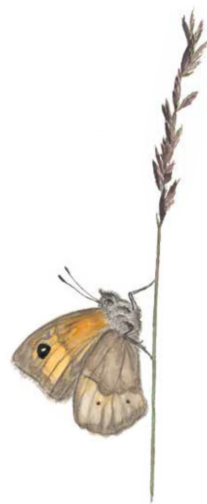
Slättergräsfjäril ( Maniola jurtina ) på rödsvingel ( Festuca rubra ). Meadow brown butterfly ( Maniola jurtina ) on red fescue grass ( Festuca rubra ).