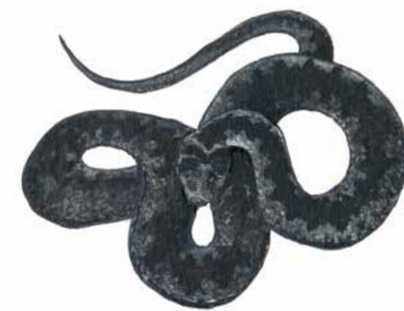
Kanske kan man träffa på en huggorm ( Vipera berus ) i en stenig åkerholme. You might meet an adder ( Vipera berus ) in a stony uncultivated islet in between the arable fields.

Reservatsgräns Reserve boundary Parkering Car park Traktörväg / stig Path Här är du You are here