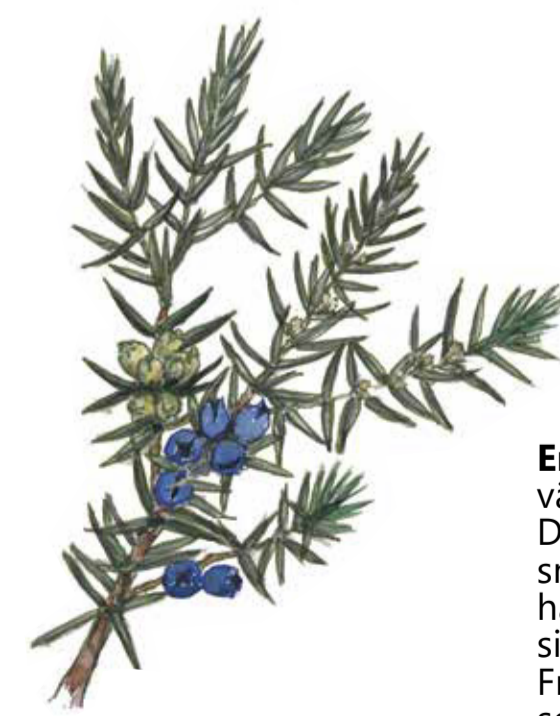
En ( Juniperus communis ) växer på fäladsmarkerna. Den taggiga busken har små gula blommor där han- och hoblomorna sitter på skilda buskar. Frukten är ett tvåårigt bär som är grönt det första året och året därpå blir frostigt mörkblått. Bären är en utmärkt krydda till viltkött eller enbärdricka.