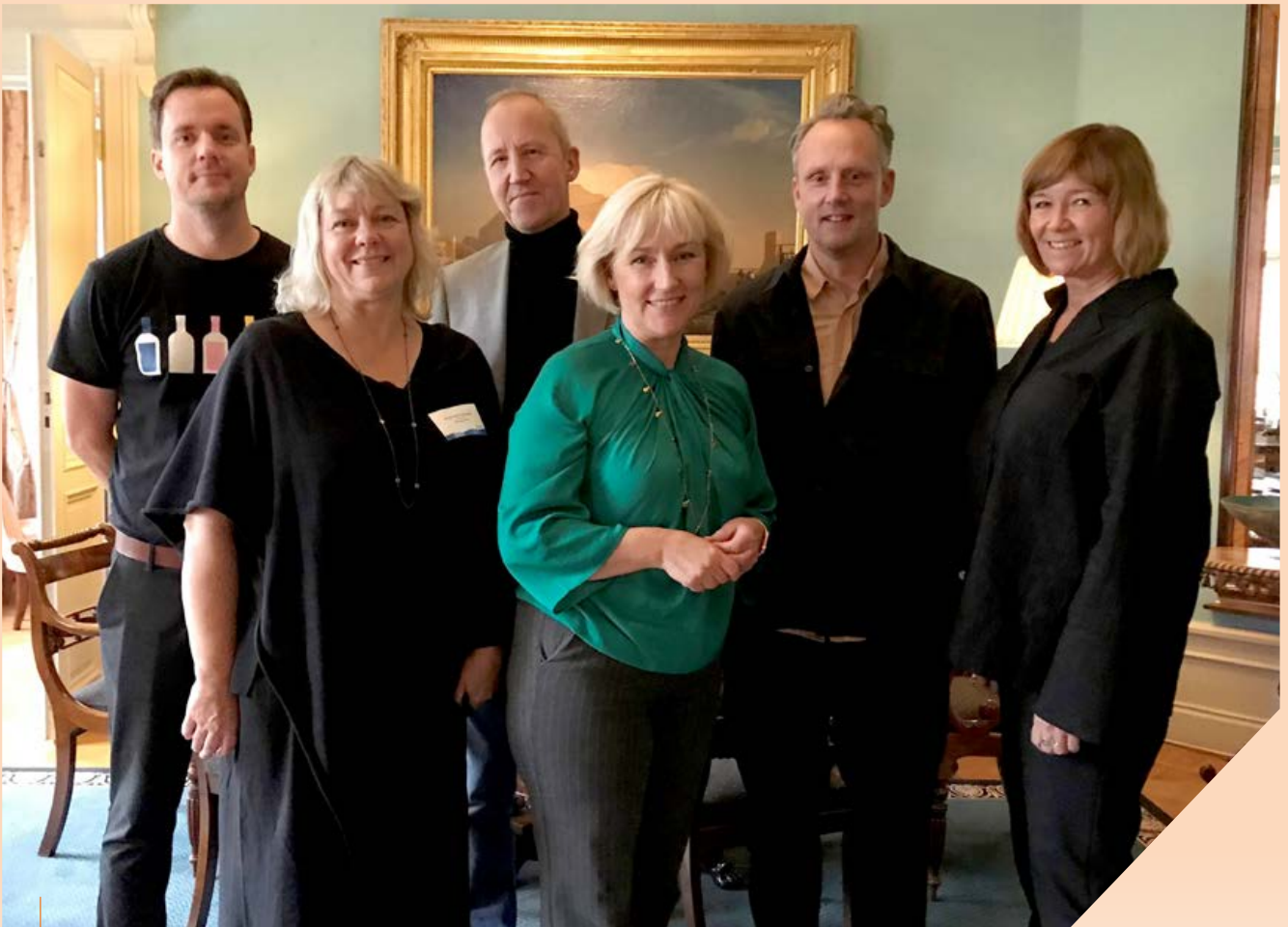
Expertpanelen på Växtkraftdagen.