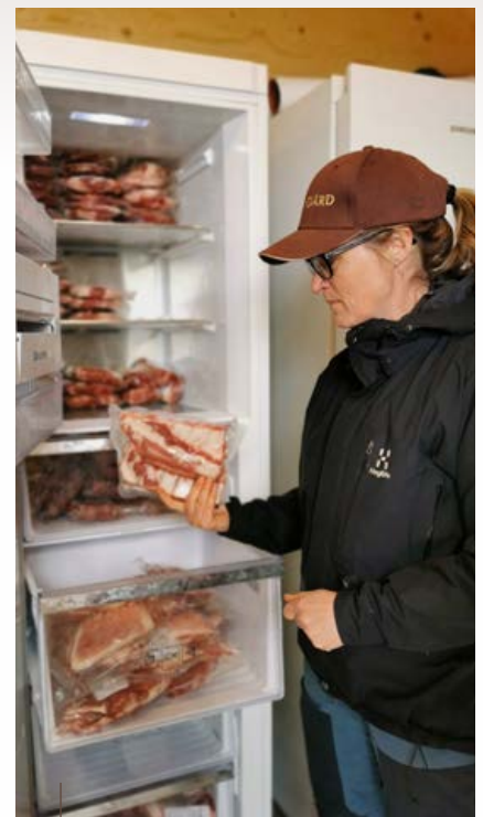
Köttet från får och lamm säljs från gården, i REKO-ring och till restaurang.