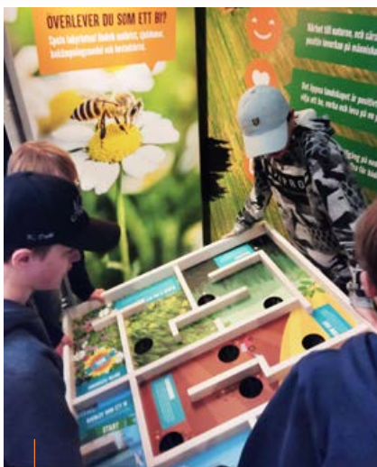
Eleverna från Lejonströmsskolan försöker hjälpa "biet" fram till blomsteräng, det är knepigt men det går, precis som i verkligheten.

MatValet är ett resultat av ett samarbetsprojekt mellan Länsstyrelsen i Västerbotten, science center Exploratoriet, LRF Västerbotten och Universitets- och högskolerådets verksamhet "Den globala skolan region Nord". MatValet, med alla sina delar, ska lära högstadieelever mer om hållbar matproduktion och konsumtion. Skolprogrammet är kopplat till läroplanen. Förutom den fysiska utställning på Exploratoriet science center i Skellefteå finns även ett digitalt material som kan användas av alla högstadieskolor i Västerbotten hemma i klassrummet. Skolor i länet som använder det digitala materialet är dessutom med och tävlar om en resa till utställningen. När fler högstadiopedagoger i länet inser fördelen