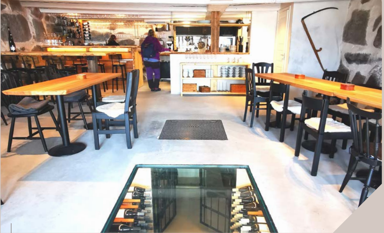
Restaurang Euste Gård där den gamla urinbrunnen blev vinkällare.