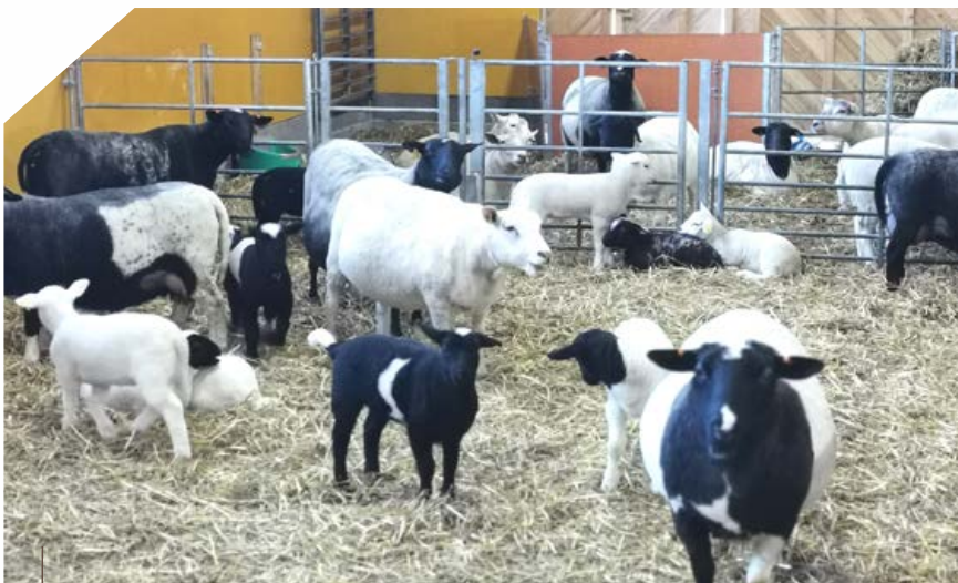
Fåren är främst kötttras med Dorper och Texel som stomme.