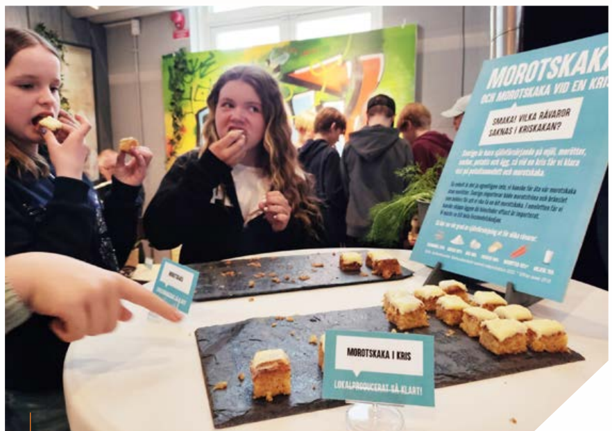
Om Sveriges gränser stängs hur smakar morotskakan då?