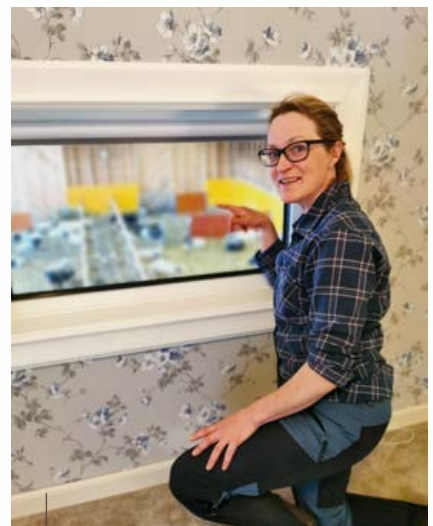
Från Herdekammaren på Västi Gård ser du från sängen ned i fårhuset.