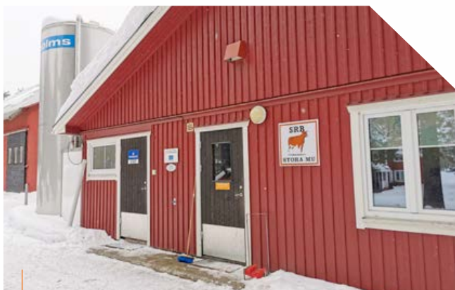
En mjölkstilo utanför byggnaden gjorde att man slapp större ombyggnationer inomhus för att få plats med en större mjölktank.

för framtiden, säger Johan. I och med den senaste ombyggnaden har verksamheten ökat till det dubbla. –Vi har varit noga med att aldrig bygga fast oss och att vara flexibla. Vi placerade till exempel foderutrymmet bredvid stallet när vi byggde ut 2010 istället för att lägga det i kortändan. Då blev det enkelt att bara förlänga byggnaden när vi ville växa. Att helt gå över till plansilo är också ett sätt att vara mer flexibel samtidigt som vi får en jämnare foderkvalitet, fortsätter han. I nära anslutning till lagården ligger ett antal stora plansilofack. Vi har god kapacitet och vi slipper köpa in balplast och vara beroende av att köpa tjänster. En stor lagringskapacitet för gödsel är också viktigt. –Vi kan anpassa spridningen efter växtligheten och behöver inte tömma tidigt på våren eller sent på hösten, utan sprider när det ger mest effekt istället. När vi frågar om det finns några nya