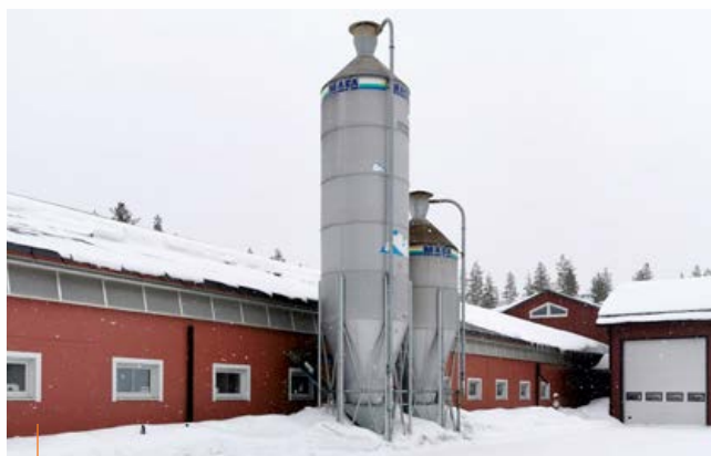
Tack vare att man inte placerat foderutrymmen i kortändan av stallet när det byggdes 2010 var det enklare att förlänga byggnaden.