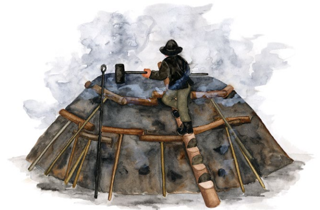
Kolmila. Illustration: Margareta Hildebrandt