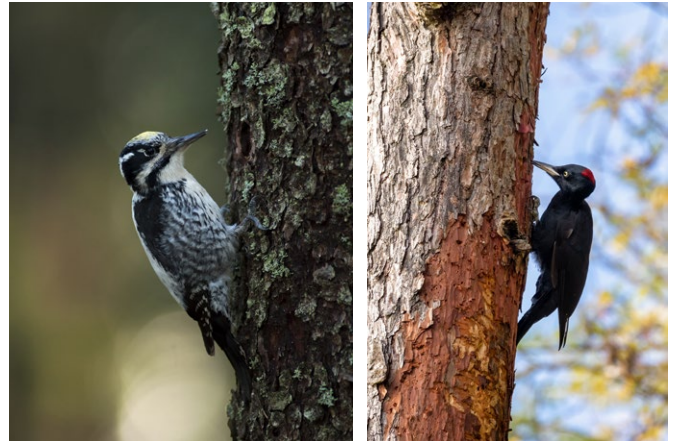
Tretåig hackspett. Spillkråka.

Här i trakten har det funnits flera torp och backstugor. Nyströms torp var bebott fram till 1950-talet. Idag har skogen tagit över men här och var visar husgrunder, röjningsrösen och fruktträd var hus och åkrar en gång funnits. Här och var i skogen finns spår efter tillverkning av träkol, i form av kolbottnar där kolmilan en gång stod. Kolning var en viktig inkomstkälla för traktens torpare. Det färdiga kolet användes för att tillverka järn i hyttorna.