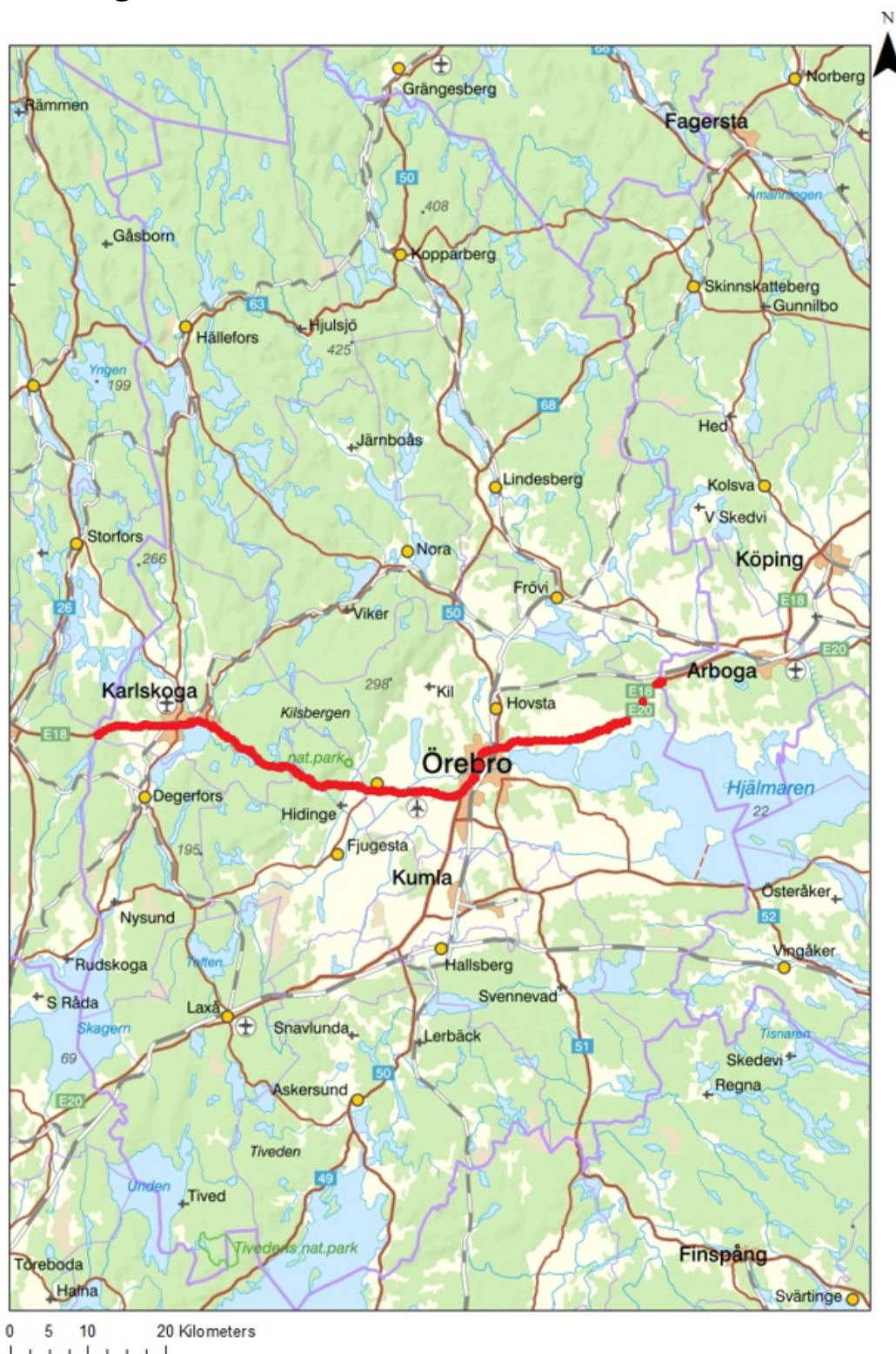
Figur 3. Kartbild över Örebro län. Länet delas upp i två jaktområden under perioden 1 – 14 mars 2024: norra länsdelen och södra länsdelen. Under tiden 15 mars – 31 mars 2024 får eventuellt kvarvarande lodjur fällas i hela Örebro län. Gränsen mellan jaktområdena visas med en tjock röd linje. Licensjakt får ske den 1 mars – 31 mars 2024, eller till den tidigare tidpunkt då Länsstyrelsen avlyser jakten.